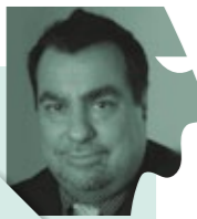
Νικόλαος Σοφικίτης Καθηγητής Ουρολογίας Πανεπιστημίου Ιωαννίνων