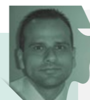
Ιωάννης Αδαμάκης Αναπλ. Καθηγητής Ουρολογίας, ΕΚΠΑ

«Σε ένα τέταρτο τελειώνω –περιτομή έχω» λέμε συχνά στο χειρουργείο. Όμως οι επιπλοκές είναι συχνές σε κάθε επέμβαση στο πέος. Από την περιτομή και τον καυτηριασμό κονδυλωμάτων, μέχρι τις πλαστικές της κάμψης και της νόσου Peyronie. Σε ένα όργανο όπου το αισθητικό αποτέλεσμα παίζει κρίσιμο ρόλο, η σωστή αντιμετώπιση της επιπλοκής είναι καθοριστική.