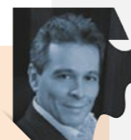
Βασίλης Πρωτογέρου Αναπληρωτής Καθηγητής Ουρολογίας ΕΚΠΑ