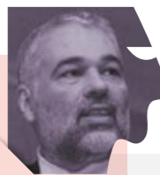
Δημήτρης Χατζηχρήστου Καθηγητής Ουρολογίας Α.Π.Θ.