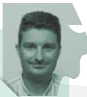
Φώτης Δημητριάδης Επίκουρος Καθηγητής Ουρολογίας Α.Π.Θ.

Καθημερινά στο ιατρείο μας υποδεχόμαστε πληθώρα ανδρολογικών περιστατικών που μας προβληματίζουν ενώ κάποιες φορές το αποτέλεσμα δεν είναι το επιθυμητό ή κάποια επιπλοκή μας φέρνει σε δύσκολη θέση. Πώς θα διορθώσουμε το λάθος; Πώς θα αντιμετωπίσουμε την επιπλοκή; Οι γνώσεις υπάρχουν αλλά τα βήματα μας δυσκολεύουν. Η παρακολούθηση και προσαρμογή της θεραπείας όταν δεν αποδίδει κάνει την κατάσταση ακόμη πιο δύσκολη. Η ανάγκη αντιμετώπισης της επιπλοκής με επιτυχία προσθέτει ένα τεράστιο άγχος. Πέντε τέτοια περιστατικά θα παρουσιαστούν βήμα-βήμα και μαζί θα αποφασίσουμε για την καλύτερη αντιμετώπισή τους.